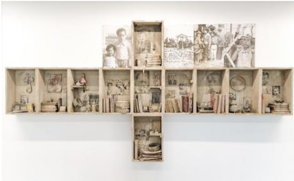
Le mémoire des indésirables , 2020. Installation 180 x 400 x 20 cm. Exposition « Distance Ardente », Musée Régional d'Art Contemporain d'Occitanie. Saison Africa 2020

Hassan Bourkia est né le 19 Décembre 1956 à El Ksiba, près de Beni Mellal. Il est écrivain, traducteur et artiste plasticien. Il enseigne la littérature depuis 1982, et expose depuis le début des années 1990 dans les plus importantes galeries au Maroc, et dans différents lieux à l'étranger. Il a participé récemment à la Biennale d'art contemporain de Buenos Aires (Bienalsur), et ses œuvres font parties de plusieurs grandes collections privées et Musées.