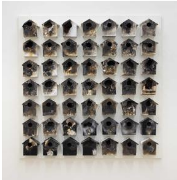
Aller simple , 2020. Installation.