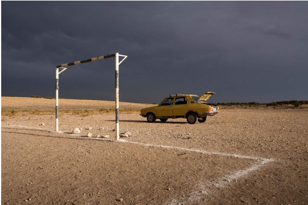
KHALIL NEMMAOUI, Sans titre #11, 2018, Série Air Twelve Land, Edition 1/3 + 1EA, Tirage pigmentaire contrecollé sur dibond sous diasec, ,150 x 200 cm

Refuser la fatalité, combattre le temps, vivre sous l'influence des traditions et des pouvoirs, aborder les luttes invisibles, sont les éléments du parcours artistique qui sera proposé au public.