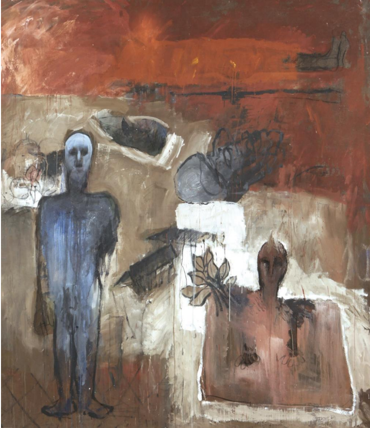
MOHAMMED KACIMI, Technique mixte sur toile, 180x158 cm