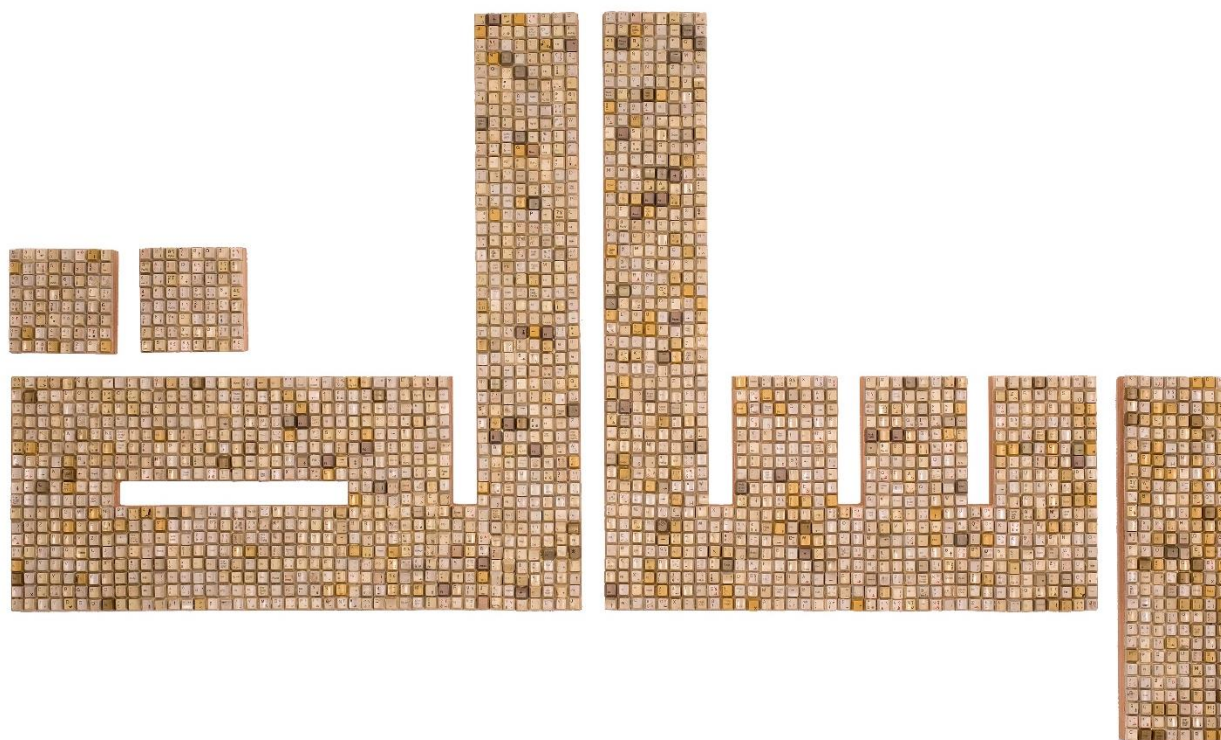
RISSALA - MESSAGE, 2018 Installation, Touches de claviers sur bois, Edition 1/3 + EA, 101 x 169 cm,